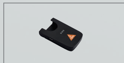
Caja de carga CC1 [02]