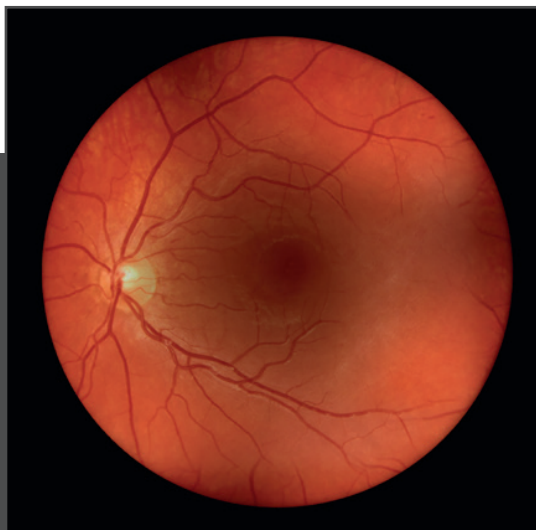
Vista de una retina a través de una catarata con visionBOOST*