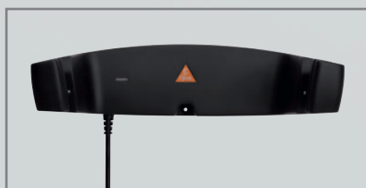
Cargador de pared CW1 [05]